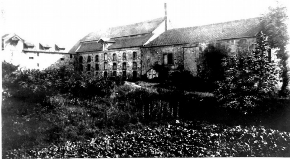
Das Schloss nach dem Brand, rechts das Ständehaus

Das Foto ist nach dem Brand aufgenommen worden. Das ursprüngliche Palais im Süden der Schlossanlage steht nicht mehr und der Fotograf steht auf der südwestlichen Ecke des Burgwalls. Im Anschluss an das Ständehaus sind zwei gut erhaltene Gebäude zu erkennen. Ebenso auf der u.a. Katasterkarte, in der am unteren Rand schon das heutige Verwaltungsgebäude eingezeichnet ist.