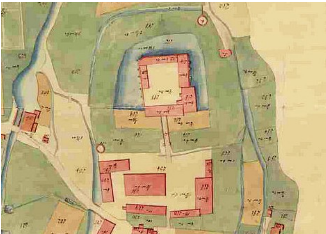
Das erhaltene Schloss vor dem großen Brand 1859 (hier 1777)

Im Zusammenhang mit der Vorbereitung einer Führung rund um den Amtsplatz und einer kleinen Publikation dazu (Von der Vorburg zur „Guten Stube“) sind wir über ein Foto und einige Katasterkarten gestolpert.